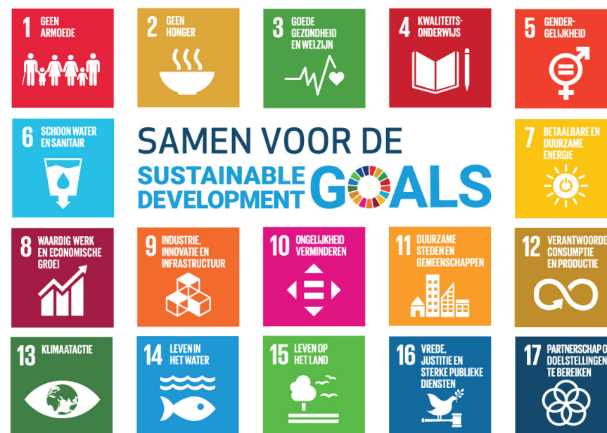
Figuur 4: De 17 Duurzame Ontwikkelingsdoelstellingen van de Verenigde Naties

We noemen deze beleggingen Sustainable Development Investments (SDI). Om te bepalen of een onderneming voldoende aantoonbaar bijdraagt aan de SDG's gebruiken we de methode die we samen met andere financiële instellingen hebben ontwikkeld. Een belegging kwalificeert als SDI wanneer ten minste 10% van haar omzet aantoonbaar bijdraagt aan één of meerdere SDG's, en wanneer deze activiteiten geen significante negatieve effecten hebben op andere duurzaamheidsdoelstellingen. PFZW beoordeelt dit systematisch via een methodologie die omzetcategorieën koppelt aan specifieke SDG-doelen.